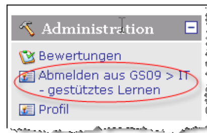
Abbildung 4: Abmelden aus Kursen

Es werden nur die Einträge, die Sie in dem jeweiligen, gewählten „Kurs“ gemacht haben gelöscht.