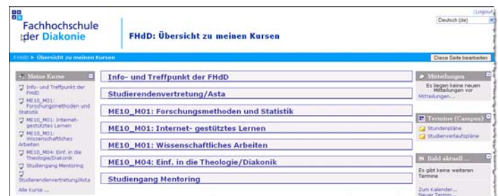
Abbildung 2: MyMoodle (Start und –Übersichtsseite)

Im Inhaltsbereich (Mitte) bekommen Sie unterhalb der einzelnen Kurse neue Forenbeiträge und terminierte Aufgaben aus den Einzelnen Kursräumen angezeigt, jedoch nicht ob neue Materialien in den Kursraum eingestellt worden sind. Diese Information erhalten Sie, indem Sie den entsprechenden Kursraum aufrufen und im rechten Menü unter „Neue Aktivitäten“ nachschauen.