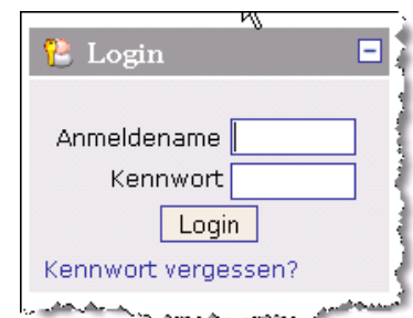
Abbildung 1: Login

Nach Eingabe der Internetadresse http://fhdd.diakonie-netz.de in Ihrem Browser gelangen Sie auf die Anmeldeseite der Moodle-Lernumgebung. Hier werden Sie aufgefordert auf der linken Seite Ihren Anmeldenamen und Ihr Kennwort einzugeben. Nach drücken des Login-Buttons gelangen Sie zu Ihrer persönlichen Startseite „MyMoodle“.